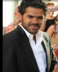
Jamel Debbouze Acteur, humoriste, producteur