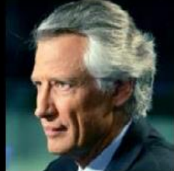
Dominique de Villepin Ancien Premier Ministre