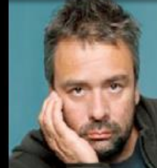
Luc Besson Réalisateur, scénariste, producteur