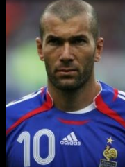
Zinedine Zidane Joueur de football international, entraîneur