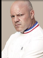
Philippe Etchebest Chef Étoilé