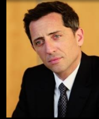
Gad Elmaleh Acteur, humoriste, réalisateur